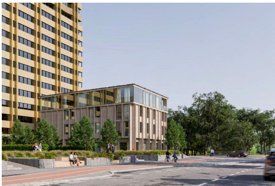
East Square Gatuvi Hornsgatan.