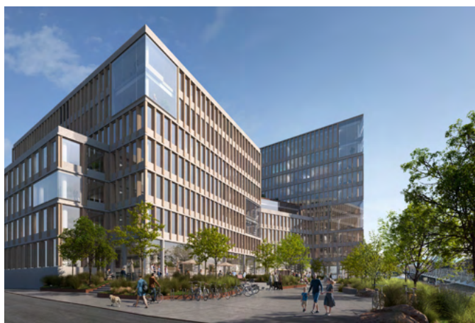
Campus Ullevål. Illustrasjon 3D Estate.