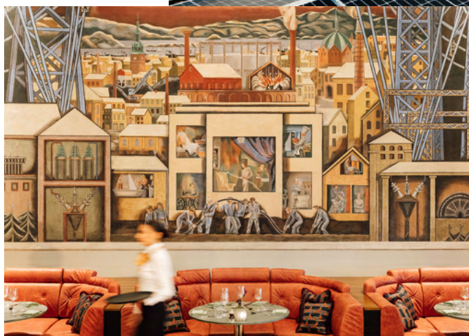
Sommerro, Krohng.

Ansvarlig utgiver Aspelin Ramm Eiendom AS Besøksadresse: Vulkan 16, 0178 Oslo Postadresse: Postboks 389 Sentrum, 0102 Oslo Telefon: 22 40 40 00 E-post: post@aspelinramm.no www.aspelinramm.no