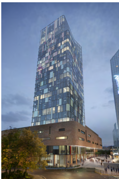
Spektrum. Illustrasjon LPO Arkitekter.

Forsikringsselskapet dekker sikredes erstatningsansvar for formueskade, herunder personlig ansvar for konsernets gjeld, som skyldes krav fremsatt mot sikrede i forsikringsperioden som følge av en ansvarsbetingende handling eller unnlattelse i sikredes egenskap av daglig leder, styremedlem, medlem av ledelsen, «de facto director», «shadow director», eller ansatt i konsernet som kan pådra seg et selvstendig ledelsesansvar.