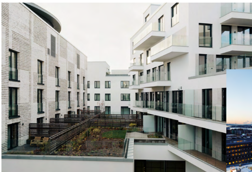
Sommerrokkvartalet